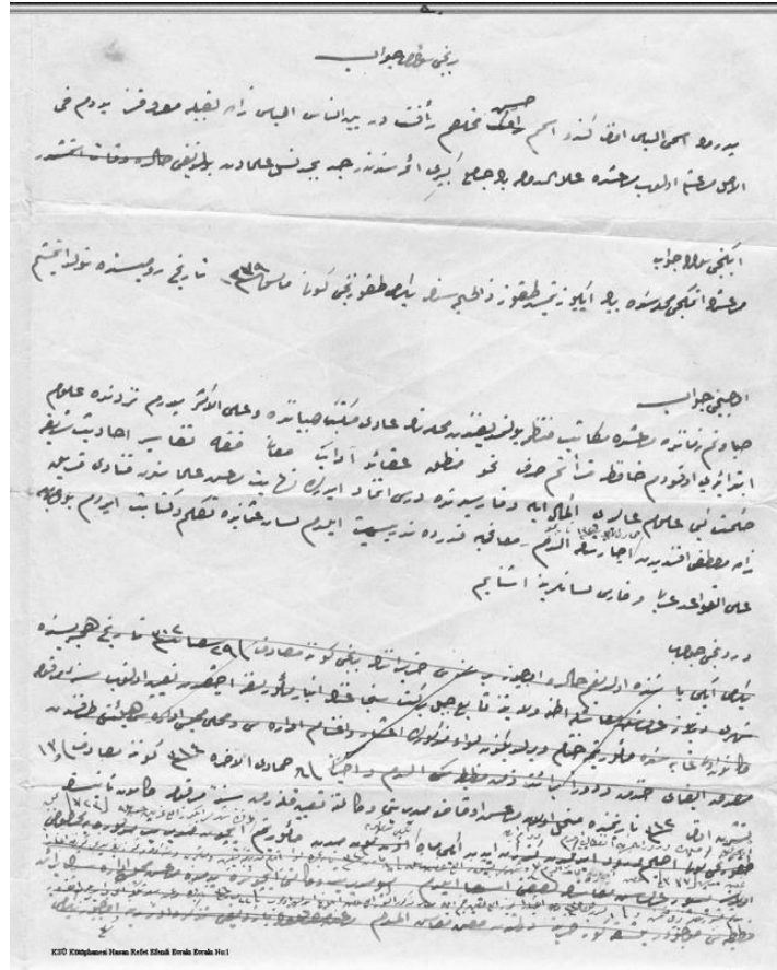
Hasan Refet Efendi Tercüme-i Hâl (Sayfa 1)