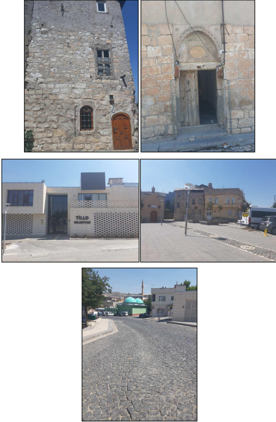
Fotoğraf 6-7-8-9-10: Tillo'dan Görünümler

Son yıllarda Tillo'da Toplu Konut İdaresi Başkanlığı (TOKİ)'nin yürüttüğü projelerle yeni konutlar yapılmaktadır. Ancak yapılması düşünülen apartmanlar çok katlı olmayıp en fazla üç katlıdır: